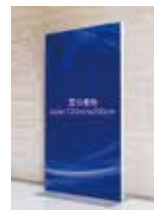
スポンサー 宣伝看板