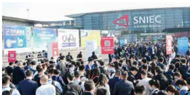
PTC上海2021 開催実績: 出展 1,500社